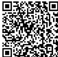
学术桥引才管理系统 单位登录