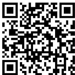
学术桥官网-职位检索 zpjob.acabridge.cn/lists

请您将委托函发送至秘书处邮箱（office@hr.edu.cn），或联系学术桥各地工作人员。